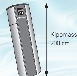
Kippmass 200 cm